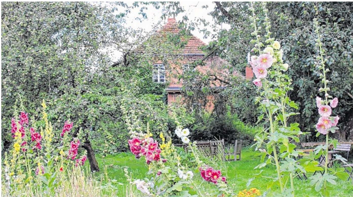
Bunte Blumenpracht im Garten des alten Pfarrhauses in Qualitz.